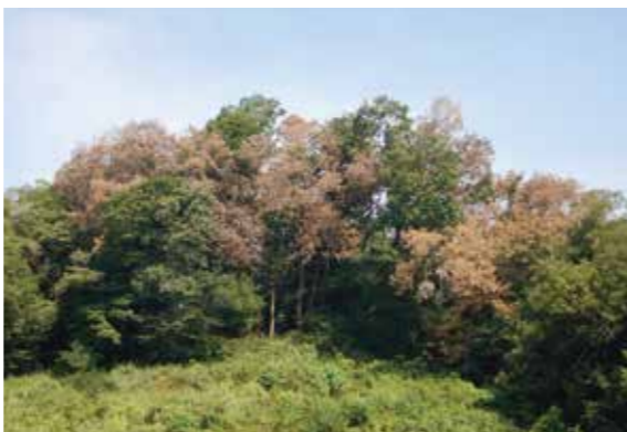
「秦野市菖蒲 県森連林業センター土壌上のナラ枯れ」2020.8月