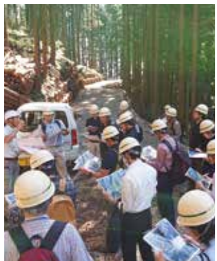
秦野市森林組合生産地視察 秦野市養毛地内

協会は県内全市町村と県森連・森林組合を会員とする団体であるため、県は令和元年度から施行された森林経営管理法及び森林環境譲与税に関する取組を支援することを目的とした「市町村林政支援業務」を協会に委託し、現在は本業務の担当となっています。当業務は県の普及事業の一環として位置付けられており、全市町村が支援対象となっており、全川崎市や三浦市など行ったことが無い都市部の市町村へも出向き、森林整備や木材利用に関するアドバイスを行いました。初年度だったこともあり「林業」という視点がない