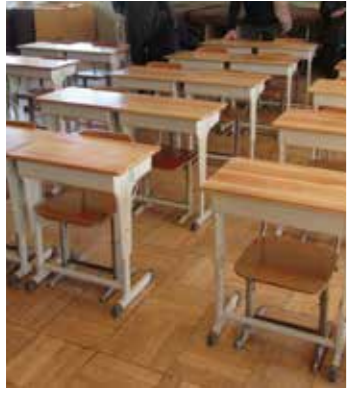
県産材天板を使った学習机

一方、神奈川県の場合、水環境保全税による取組とのすみ分けがありますし、全国的に見て都市