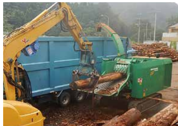
ウッドハッカー MEGA540 (中央：緑)

発電用チップ生産本格稼働 木質高速破砕機 ウッドハッカー 導入 令和2年4月より「ウッドハッカー MEGA540」を導入し製品チップ生産の本格稼働に入りました。 平成30年に導入(中古)チップパーは、令和元年10月より生産を開始しました。しかし、当初計画の年間1,300tに対して実績は、353tと振るいませんでした。