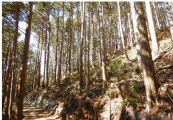
湯河原町地域水源林長期施業受委託契約地 湯河原町吉浜地内

りますが、間伐材を搬出し整備地内の残材(未利用材)を極力少なくし丁寧な山づくりを実施することで、このところ多発する集中豪雨での山林内からの残材の流出防止に繋がることと捉え整備に取り組んでいます。