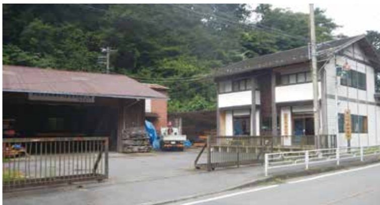
愛川町森林組合 事務所棟 (右) と製材棟 (左)