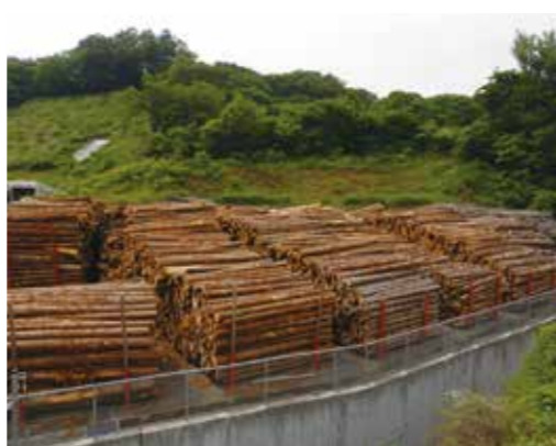
チップ処理を待つ原木の積みみ

時間、その他、自走式のためチップのストックヤードや丸太の集積箇所でも作業が出来る事とチップ運搬車に直接チップを吹く(積込)ことも出来る仕様であることから、燃料用チップの生産も4月は265t、5月は397t(他パーク51t)でしたが、6月は698t(他パーク31t)7月は700tと月毎に増産し本格的に稼働することが叶いました。この陰には、加工担当職員の汗と苦悩、努力があったことは言うまでもありません。 このスピードアップにより、逆にチップ原材料用の原木を十分に集荷できる不安もありましたが、系統の森林組合をはじめとする出荷者の皆様のおかげで、今年度も順調に入荷し、7月までの4か月で1,811tの入荷を頂きました。 また、運搬については、株式会社タケエイグリーンリサイクルと運搬契約を締結することによって、横須賀バイオマスマスエナジーのチップ